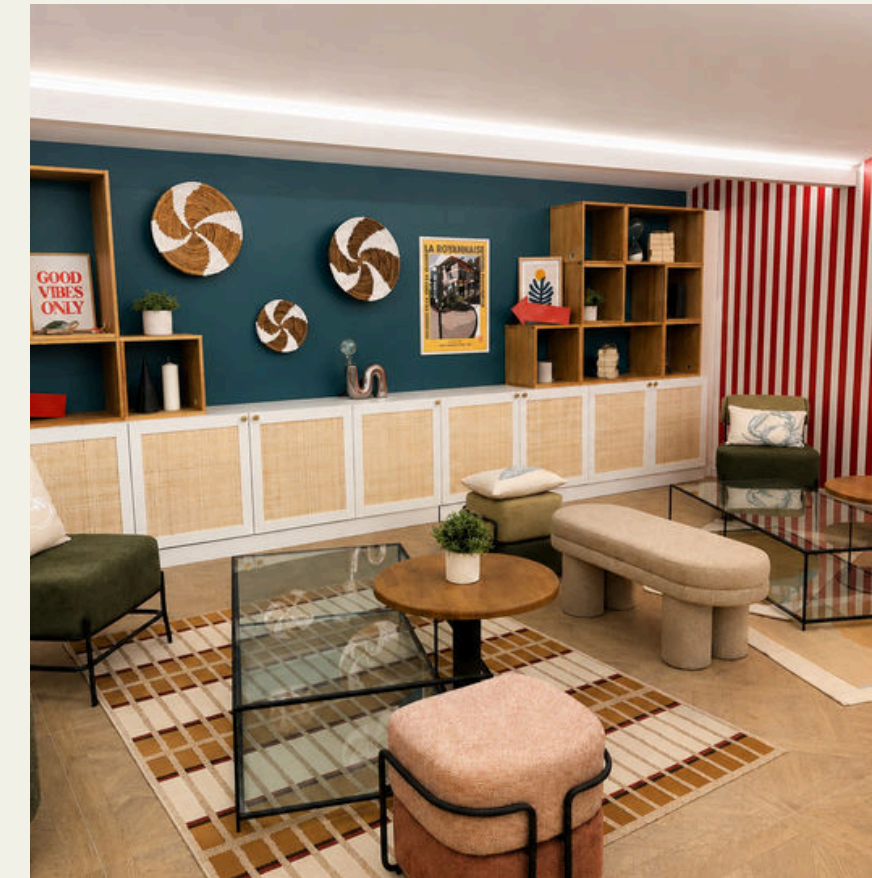
COIN DÉTENTE MODULABLE ↗